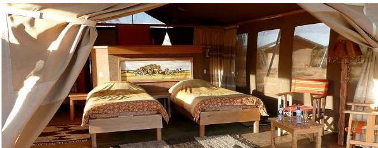
Installation dans votre tente, dîner logement.