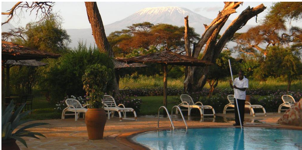
Safari en véhicule 4x4 avec toit ouvrant dans parc national d'Amboseli Retour au Lodge en fin de journée, dîner logement

Cette variété de paysages a permis le développement d'une faune particulièrement riche : zèbres, gnous, girafes, buffles, lions, hyènes, chacals, guépards, léopards, servals et caracas. Arrivée tardive au Sentrim Amboseli ou similaire www.sentrimhotels.net situé à proximité immédiate d'Amboseli, près de la porte de Kimana, au sud-est de la réserve. La vue sur le Kilimandjaro, par temps clair, est éblouissante...Les parties communes, le bar et le restaurant se tiennent sous des toits de makuti. Les 60 tentes offrent un excellent confort. Très spacieuses, elles comportent un plancher "en dur", une terrasse et une structure avec un toit sous laquelle se dresse la tente. A l'intérieur, coin salon, ventilateur, coffre-fort, grande salle de bains avec douche...Une grande piscine vous accueillera aux heures les plus chaudes de la journée