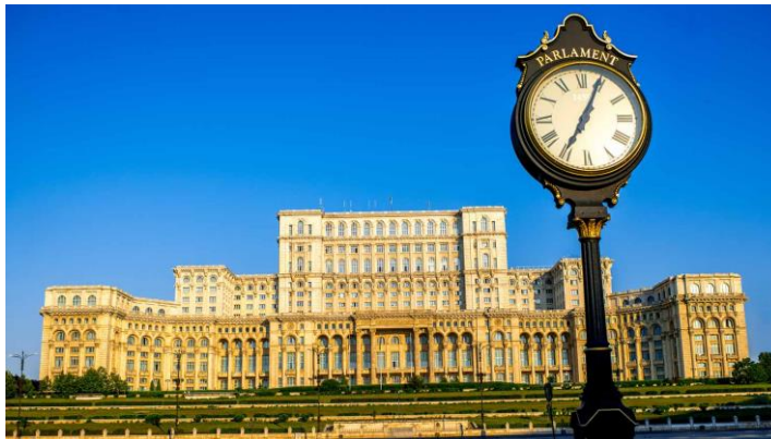
Palais du Parlement