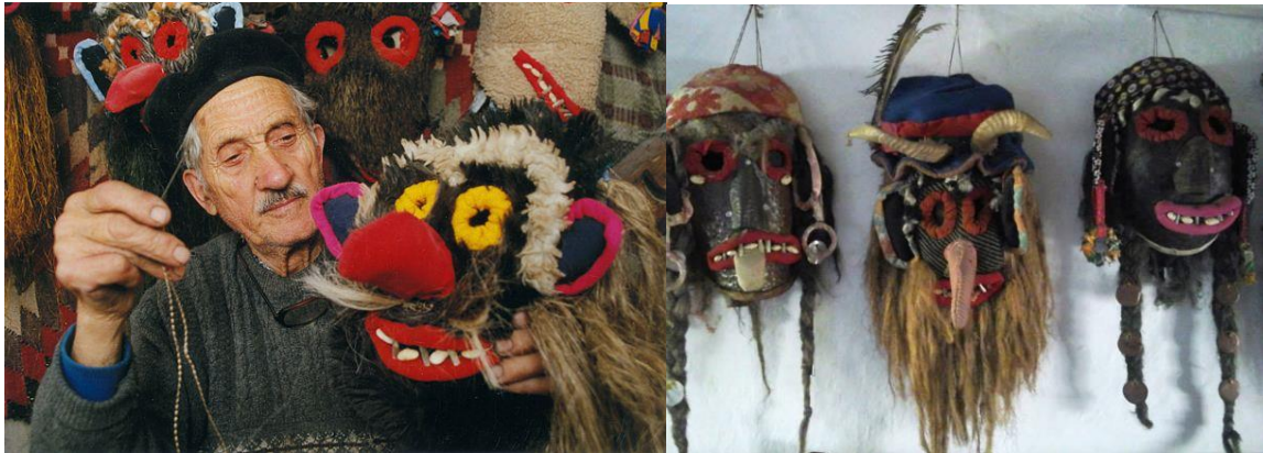
Creation de masques populaire

Visite du monastère Neamt/Agapia et traversée des gorges de Biczaz à pied (en fonction des conditions météo), poursuite vers le lac Rouge. Déjeuner dans un restaurant local Tarpesti/Lacu Rosu . Continuation pour Brasov . Installation à l'hôtel 3* pour 2 nuits. Dîner libre .