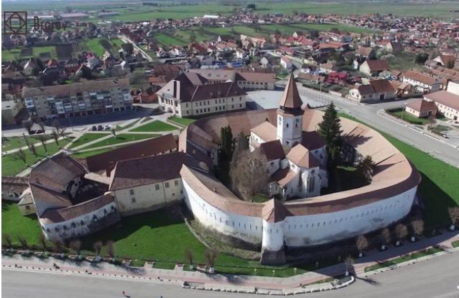
L'église fortifiée Prejmer

Ensuite route vers Bran et visite du célèbre château médiéval construit sur un rocher par les habitants de Brasov en 1377 pour défendre leur ville. Vlad a utilisé ce château comme quartier général pour ses incursions en Transylvanie. En 1922, la reine Marie le transforma en résidence d'été. Depuis quelques années, c'est un beau musée d'art médiéval. Retour à Brasov. Dîner libre a Brasov.