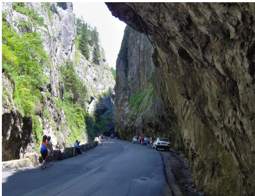
Gorges de Biczaz