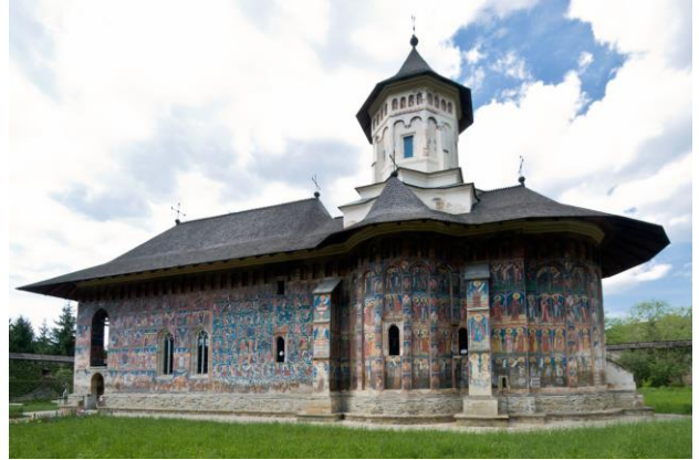
monastere de Moldovita