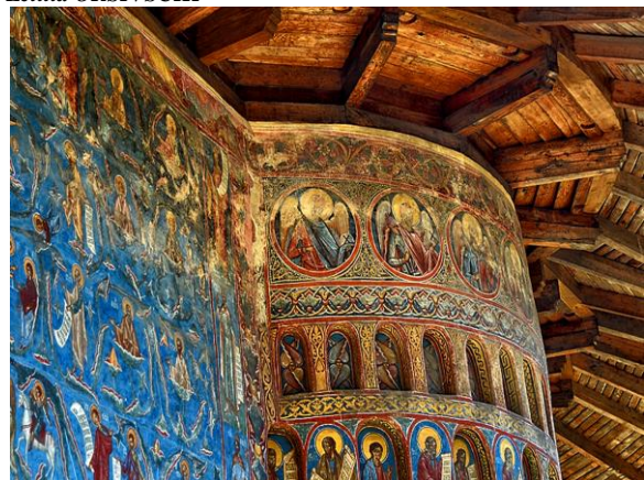
Sixtine de l'Orient