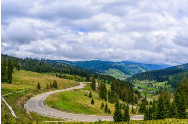
Paysage sur le route vers Campulung