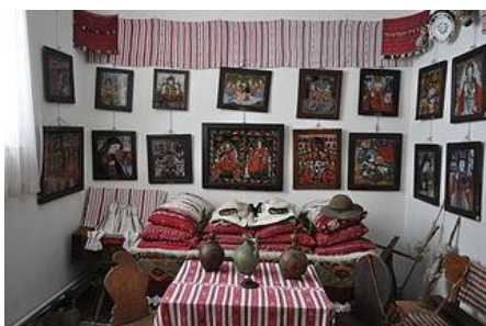
Musée des icônes sur verre

Départ vers Sibi où vous visiterez le musée des icônes sur verre. Dîner avec des plats typiques a volonté (choux farcis, boulets de viande, fromage, légumes et fruits bio, apéritif – eau de vie et vin local) . Nuit chez l'habitant 3 marguerite (pension REGHINA), une occasion de partager et de connaître leurs traditions et coutumes.