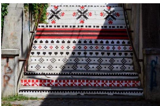
Targu Mures Bistrita