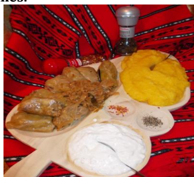
plat traditionnel roumain