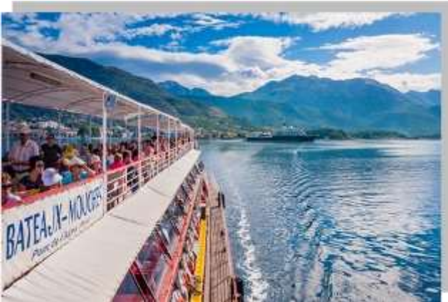
Pima et la pittoresque place d'Armes.

entièrement encerclée de remparts d'une longueur totale de 4,5 km, soit deux fois plus que ceux de Dubrovnik, cette cité se distingue par la structure asymétrique de ses rues et de ses places étroites combiné avec de nombreux monuments d'influence vénitienne d'un caractère souvent unique. Chaque rue, chaque pierre, chaque église raconte un fragment de 900 années de brassage ethnique et confessionnel. Dans le centre historique, protégé par d'anciennes fortifications et classé au patrimoine mondial, vous flânerez entre petites places et églises romanes. La cathédrale de Saint-Tryphon, reconstruite au XVII e siècle après un violent tremblement de terre, mérite un arrêt lors de votre voyage à Kotor, tout comme le palais ducal, la tour de l'horloge, autrefois lieu de torture, le palais