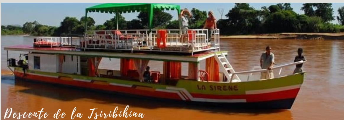
Descente de la Tsiribihina