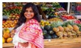
07N SUD DISCOVER