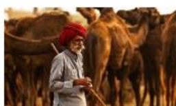
09N RAJASTHAN EVENT