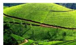
10N SUD DISCOVER