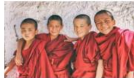
09N LADDAKH DISCOVER