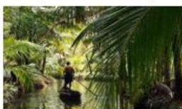
08N SUD DISCOVER