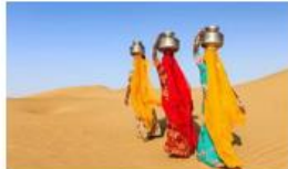
10N RAJASTHAN DISCOVER