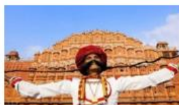
08N RAJASTHAN DISCOVER