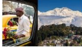
10N DARJLING SIKKIM DISCOVER