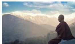
11N INDE TIBETAINE DISCOVER