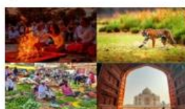
10N RAJASTHAN EXPERIENCE