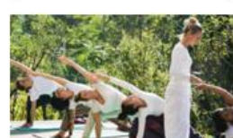
11N RAJASTHAN EXPERIENCE