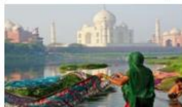
09N RAJASTHAN EXPERIENCE