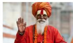
11N RAJASTHAN DISCOVER