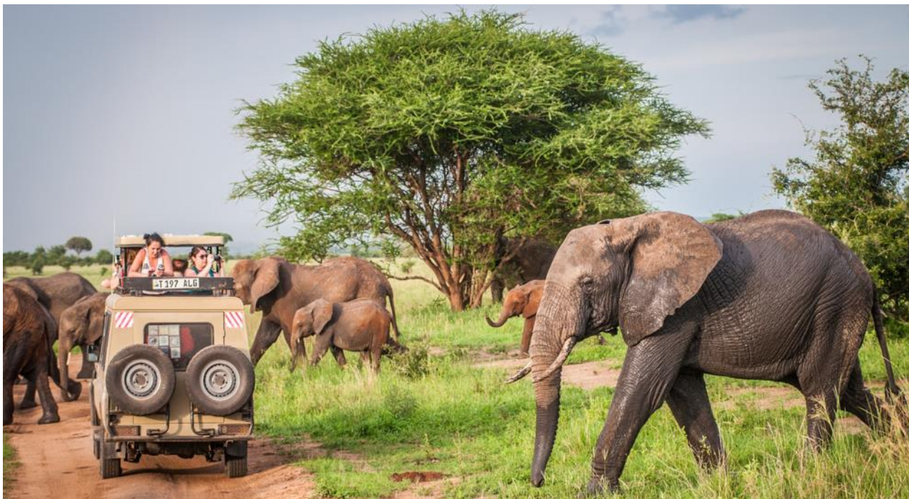
Arrivée au Migunga Forest Tented Camp ou similaire www.moivaro.com