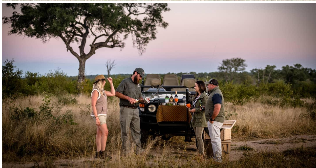
Sundown apéritif et snacks, retour au Lodge, diner logement