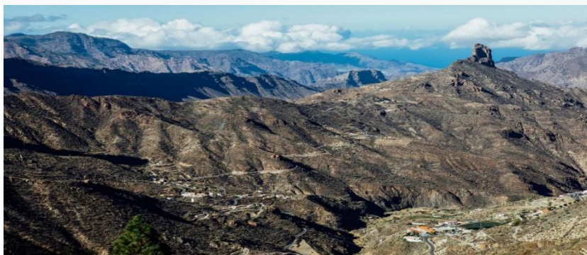
Vue panoramique sur la Caldera de Tejeda, Valleseco ou Teror et Arucas.

L'un des sites les plus connus de Gran Canaria est celui de ce point de vue-centre d'interprétation d'où vous pourrez admirer la vue sur le bassin de Tejeda. Le point de vue, dont la hauteur est impressionnante, s'élève sur un ancien volcan qui était autrefois le centre de l'île.